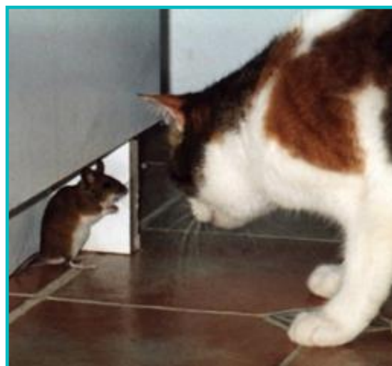
Photo 1 : Le chat s'infecte principalement par la consommation de souris.